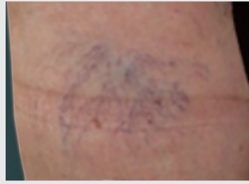
クモの巣状静脈瘤

なってプールや温泉に行けないという方も多いと思います。 これらの静脈瘤は手術をしなくても硬化剤という特殊な薬を静脈瘤に注射して治療する事ができます。注射によって静脈の内皮細胞を障害し外から弾性ストッキングや包帯で圧迫すると血管の内側の壁がくっついて血が流れなくなり使われなくなつた血管は次第に消えていきます。治療は1回10〜15分程度で終了し歩いて帰宅できます。日常生活の制限はありませんが注射した日は入浴できません。また、注射のあとは1カ月程度弾性ストッキングや包帯で注射した部位を圧迫します。診察室で簡単に治療できるメリットがありますが、再発しやすいというデメリットがあります。