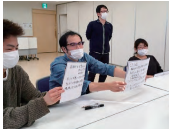
職員側のオンライン風景

服薬指導に関して、オンラインに慣れていない高齢の方、認知症の方は、インスリン・吸入薬の手技説明は画面越しでは難しいのではないか?という薬学生ならではの意見が出ました。他に、オンライン診療体制が整う事はいいが、従来の対面もおりまぜて行えないか、今後検証してすすめていくべきではないか?画面越しで、対面の差は埋められるのか?画面以外に映る病状を見逃してはいけない、患者さんの訴えには対面が必要では?などなどオンライン診療を考えるきっかけとして色々奨学生は自身の体験をふまえながら話してくれました。