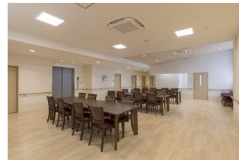
食堂・談話室 ご家族の方やお友達の方とおしゃべりやお食事を楽しんでいただけます。