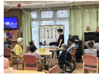
デイサービスセンター 毎日楽しいレクリエーションを行っています。