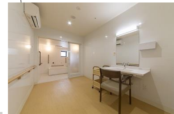
浴室・脱衣室 広々とした浴室でゆったりおくつろぎいただけます。